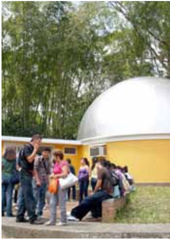
Planetario Universidad Tecnológica de Pereira

es pertinente resaltar que de la matrícula total de las Universidades Estatales, alrededor del 80% corresponde a estudiantes de estratos 1, 2 y 3.