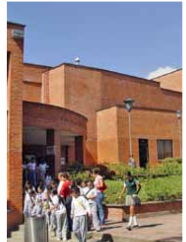
Universidad Tecnológica de Pereira

Sumado a esto, el Informe de Educación Superior en Iberoamérica publicado en el año 2011 y realizado por el Centro Interuniversitario de Desarrollo (CINDA) y Universia, muestra que las IES estatales colombianas en la vigencia 2010 asumieron el 55.38% de la matrícula nacional mientras que las IES privadas cubrieron el 44.62% restante.