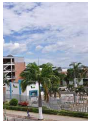
Universidad Industrial de Santander Plazoleta y tienda universitaria