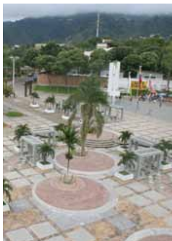
Universidad Industrial de Santander

El estudio de desfinanciación de las Universidades Estatales requería un análisis más amplio de diferentes aspectos y normas que a través del tiempo han agudizado los problemas de financiamiento del sistema; que hacen parte del desarrollo de las Instituciones y de los nuevos retos que enfrenta el país, y que no se previeron en la construcción de la Ley 30 de 1992.