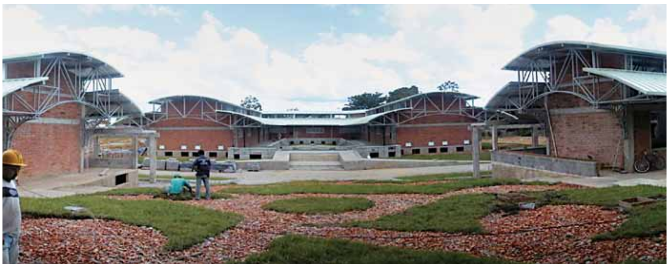
Universidad de Antioquia

En lo que toca a los esfuerzos realizados por las Universidades, éstos se hacen evidentes en los resultados arrojados en esta segunda fase, donde se costearon las inversiones ya realizadas por el Sistema Universitario Estatal y cuya cifra asciende a $7,6 billones. Paralelamente, se puede confirmar este esfuerzo con una revisión de la composición del presupuesto del conjunto de Universidades Estatales del Sistema, en donde se refleja la gestión permanente que deben realizar las Instituciones de Educación Superior para financiar con sus propios recursos más del 40% de su presupuesto.