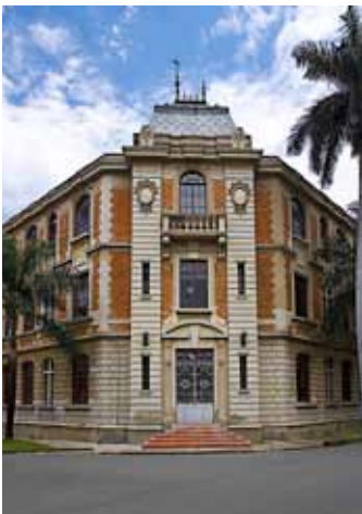
Universidad de Antioquia,

Según el Alto Tribunal, esta desigualdad en el trato, no se justifica por ningún objetivo de rango constitucional que pudiera perseguirse a través de ella y no encontró nada distinto de un mecanismo para reducir la carga prestacional de la Administración, que no justifica el desconocimiento general del principio de igualdad. Adicionalmente, la restricción que se viene comentando desconocía el principio constitucional de irrenunciabilidad a los beneficios mínimos establecidos en normas laborales. Puede decirse que, ante la incapacidad de negociar las condiciones legales de ejercicio del cargo, es la misma ley la que resulta imponiendo al servidor transitorio la inconstitucional renuncia a esta categoría de beneficios mínimos que constituyen las prestaciones sociales reconocidas a los servidores públicos.