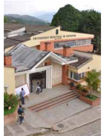
Sede Socorro Universidad Industrial de Santander