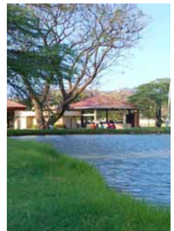
Zonas verdes Universidad del Magdalena