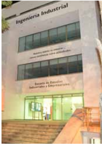
Facultad de Ingeniería Industrial Universidad Industrial de Santander