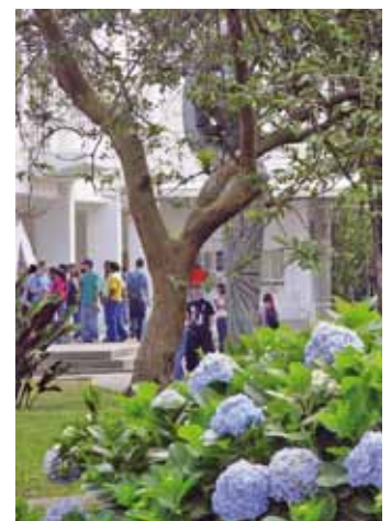
Parque de los sapos Universidad Tecnológica de Pereira