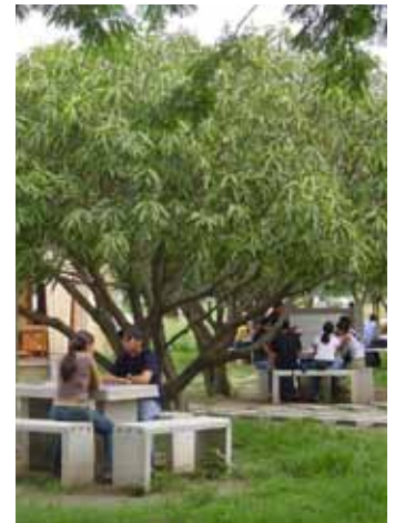
Zonas abiertas Universidad del Magdalena