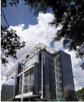
Universidad de Antioquia

para las Universidades frente a sus empleados públicos y trabajadores oficiales, se debe garantizar las partidas presupuestales para atender el incremento de estos compromisos destinados al pago de las prestaciones sociales.