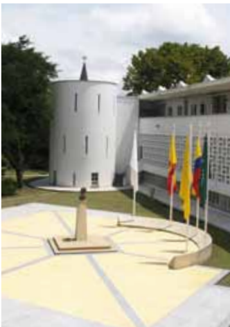
Plaza de Banderas Universidad Tecnológica de Pereira