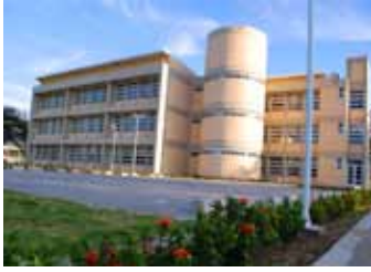
Universidad del Magdalena

En la formulación de una metodología más acertada para el aporte de recursos a las Universidades era necesario basarse en un ejercicio técnico que no sólo contemplara la variable costo del dinero sino que permitiera un análisis de acuerdo al tamaño y complejidad de cada una de ellas (número estudiantes, nivel de formación de sus docentes, grupos de investigación, número de programas en pregrado y postgrado, entre otros), los retos y metas establecidos en los planes de desarrollo y de gestión para el sector educativo; y de esa forma determinar cuáles eran los recursos necesarios tanto en funcionamiento como en inversión, que garantizaran la equidad no sólo entre las universidades sino también entre las regiones donde se encuentran las mismas.