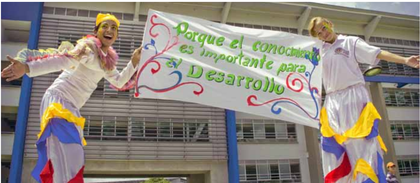
Universidad Tecnológica de Pereira

Esta inversión aunque importante no es suficiente para alcanzar la proporción mínima de docentes con formación doctoral que requiere el sistema, la cual se estimó para este ejercicio en un 30% del total de la planta docente y para aquellas universidades que ya lograron esta meta, un crecimiento adicional del 10%. Con este criterio las Universidades Estatales Colombianas le apuestan a tener 5.023 nuevos doctores en cuatro años, con un costo total de inversión de $2.1 billones, logrando con ello un total de 7.913 doctores en el sistema.