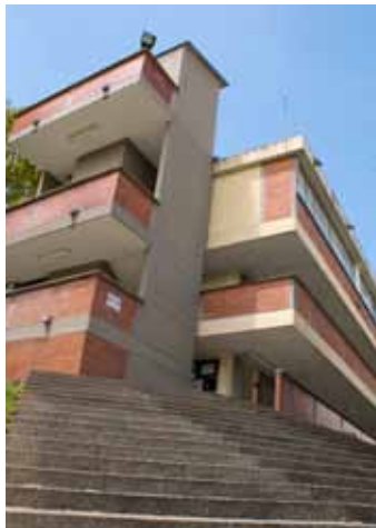
Facultad de Ingeniería Industrial Universidad Tecnológica de Pereira

inversiones en infraestructura al igual que la destinación de mayores recursos para su sostenimiento. Para el año 2003 las universidades contaban con 2.178.000 metros cuadrados construidos y para el año 2011 esta cifra se incrementó en un 28,65 %, alcanzando los 2.801.911 metros cuadrados.