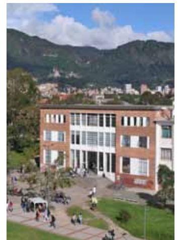
Universidad Nacional de Colombia

De igual manera y atendiendo los mismos parámetros de equidad en la contratación y garantizando el ingreso a la planta de aquellos cargos misionales, es necesario convertir 3.700 contratos administrativos ocasionales en contratos de planta, es decir, pasar de 11.499 a 15.199 cargos administrativos de planta, garantizando una proporción de un funcionario administrativo por cada 30 estudiantes, lo que significaría un aumento en la base presupuestal de $236.422 millones, cifra que representa un 10.2% del presupuesto asignado en la actualidad al sistema universitario estatal.