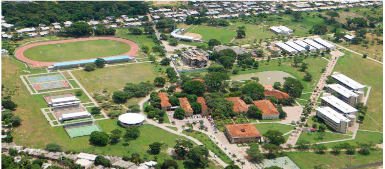
Campus Universidad del Magdalena

fesores de las universidades estatales, se evidencia en el número de revistas indexadas por Colciencias. Incluyendo todas las categorías reconocidas, se pasó de 45 revistas en el año 2003 a 148 en el año 2011.