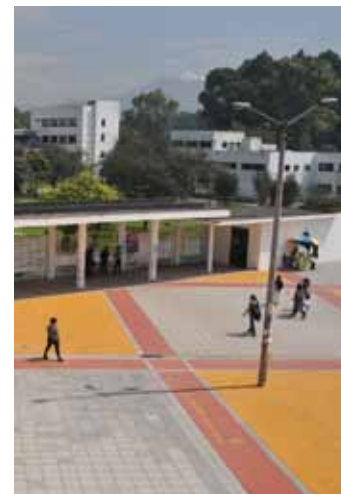
Universidad Nacional de Colombia

Este artículo ha sido entendido por los Gobiernos como un máximo y no como la garantía de un aporte mínimo.