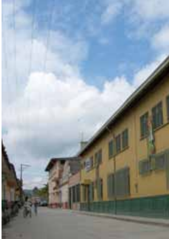
Universidad de Antioquia

Es prudente hablar ahora de los edificios coloniales ubicados en los campus universitarios, cuyo mantenimiento debe realizarse considerando lineamientos como la conservación de las características arquitectónicas, espaciales y tipológicas de los edificios que sean parte del Patrimonio Arquitectónico Cultural de cada ciudad y que la sustitución de elementos no estructurales (cornisas, puertas, ventanas, entre otros), se realice conservando las características generales y acabados utilizando materiales disponibles en el mercado cuando sea posible, en caso contrario es necesario realizar procesos de restauración de los elementos deteriorados, para lo cual las Universidades deben emplear mano de obra calificada.