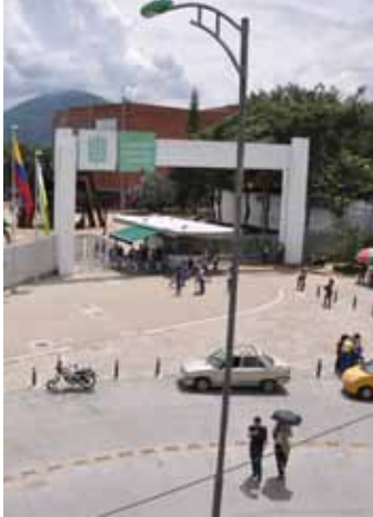
Entrada Universidad Industrial de Santander

las Universidades en los indicadores de las entidades territoriales debe verse compensado con una participación para el funcionamiento de las Universidades que a la fecha no reciben transferencias de estas entidades que signifique no menos del 1% de los ingresos tributarios del ente territorial . Cuando existan dos o más Universidades Estatales en un mismo territorio se debe garantizar el principio de equidad en la distribución de estos recursos.