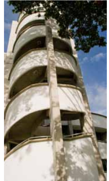
Arquitectura Universidad Tecnológica de Pereira

Es importante analizar los efectos de la Sentencia C-006 de 1996 que trató la relación estrecha entre lo laboral y la formación universitaria. Para la época en que se