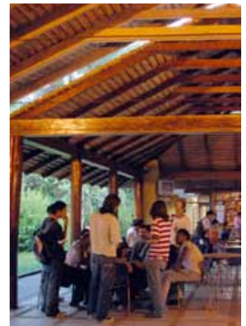
Universidad Nacional - Sede Amazonia

Lo anterior fue ratificado el pasado 28 de Junio de 2012 en la comunicación del Director General de Presupuesto al SUE, en la que literalmente dice “al financiamiento de las universidades públicas nacionales, departamentales y municipales concurre la nación mediante los aportes a los que obliga la ley, y los aportes de las entidades territoriales y los recursos propios, lo cual quiere decir que la Nación no financia los