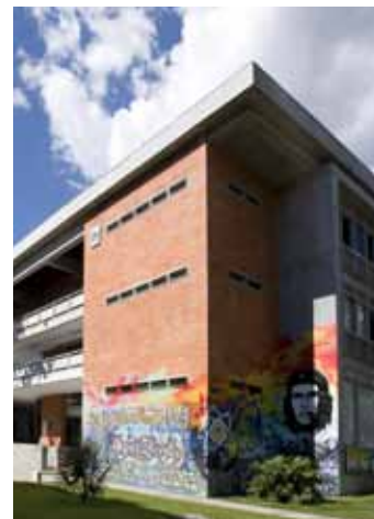
Universidad de Antioquia

En materia prestacional se ha visto afectado el presupuesto de gastos de funcionamiento, con la expedición del Decreto 404 de 2006, en virtud del cual los empleados públicos y trabajadores oficiales vinculados a las entidades públicas del orden nacional y territorial, que se retiren del servicio sin haber cumplido el año de labor, tendrán derecho a que se les reconozca en dinero y en forma proporcional al tiempo efectivamente laborado las vacaciones, la prima de vacaciones y la bonificación por recreación. Considerando que este Decreto es de obligatorio cumplimiento