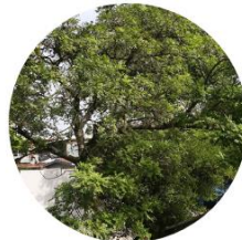
Hobo - Spondias Mombin - Campus EAFIT