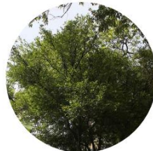
Mandarino - Citrus Reticulata - Campus EAFIT