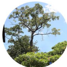
Cámbulo - Erythrina Poeppigiana - Campus EAFIT