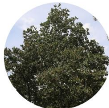
Majagua - Talipariti Tilliaceum - Campus EAFIT