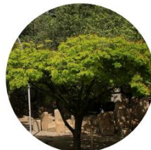
Acacia Amarilla - Caesalpinia Peltophoroides - Campus EAFIT