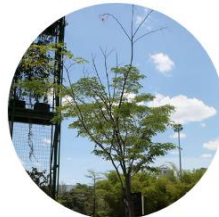
Ébano - Caesalpinia Ebano - Campus EAFIT