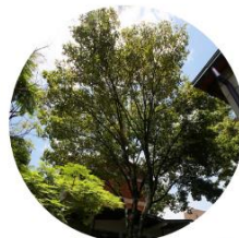
Urapán - Fraxinus Chinensis - Campus EAFIT