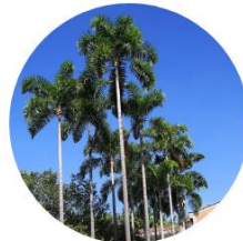
Palma Sancona - Syagrus Sancona - Campus EAFIT