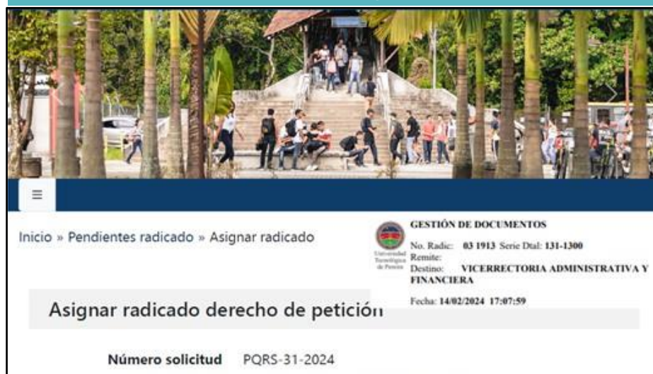
Muestra de una queja radicada