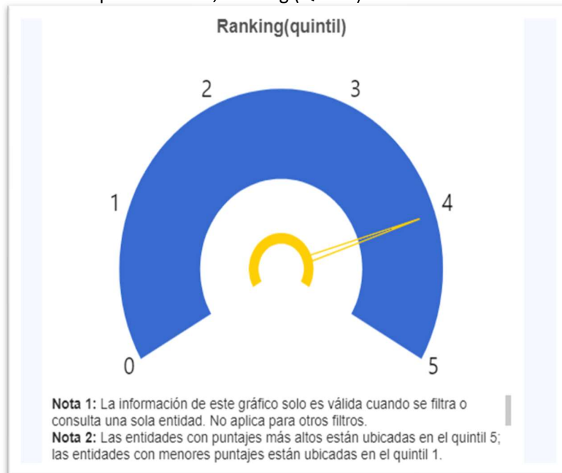
Gráfico 2. Tipo tacómetro, Ranking (Quintil)