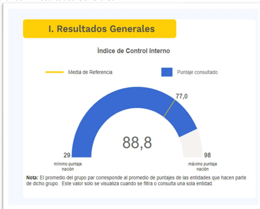
Gráfico 1. Resultados Generales

Los resultados para la Universidad Tecnológica de Pereira para la vigencia 2022 (Departamento Administrativo de la Función Pública, 2022) son los siguientes: