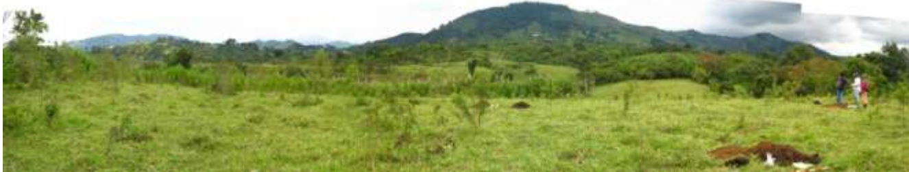
Figura 5. Plano inclinado próximo al piedemonte de la vertiente occidental de la Cordillera Central. Zona de Expansión Oriental de Pereira, sector Plan Parcial "Remanso-Guayabal".