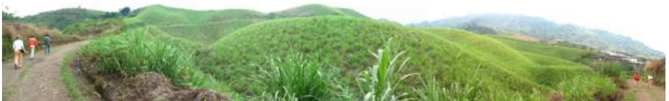
Figura 3. Colinas abanico fluvio-volcánico Pereira-Armenia. Nótese aterrazamientos en la parte derecha de la fotografía. Zona de Expansión Norte de Pereira, sector Plan Parcial "La Reina".