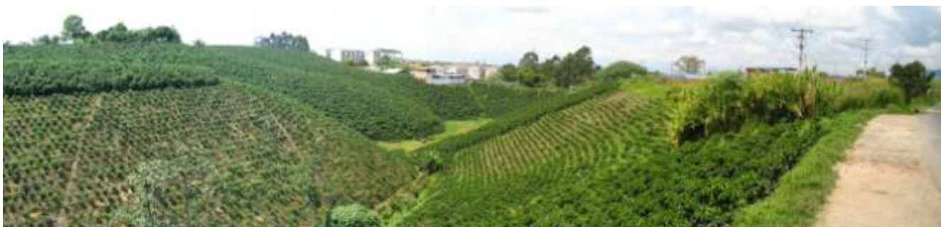
Figura 6. Colinas abanico fluvio-volcánico Pereira-Armenia. Zona de Expansión Suroccidental de Pereira, sector Plan Parcial "Gonzalo Vallejo".