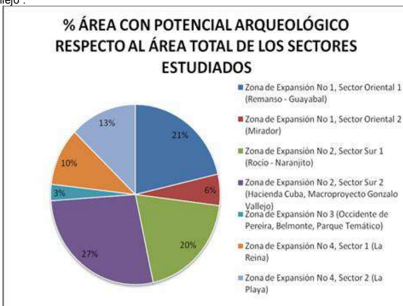
Figura 7. Porcentaje del área con potencial arqueológico respecto al área total de los sectores estudiados.