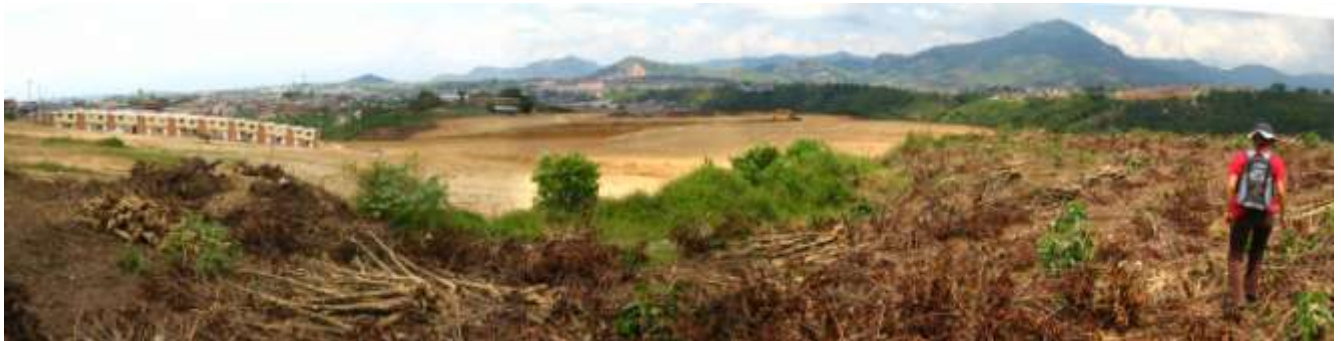
Figura 4. Remoción de tierras para construcción de proyecto urbano. Nótese intervención con maquinaria. Zona de Expansión Sur-occidental de Pereira, sector barrio Montelíbano (antigua Hacienda Cuba).