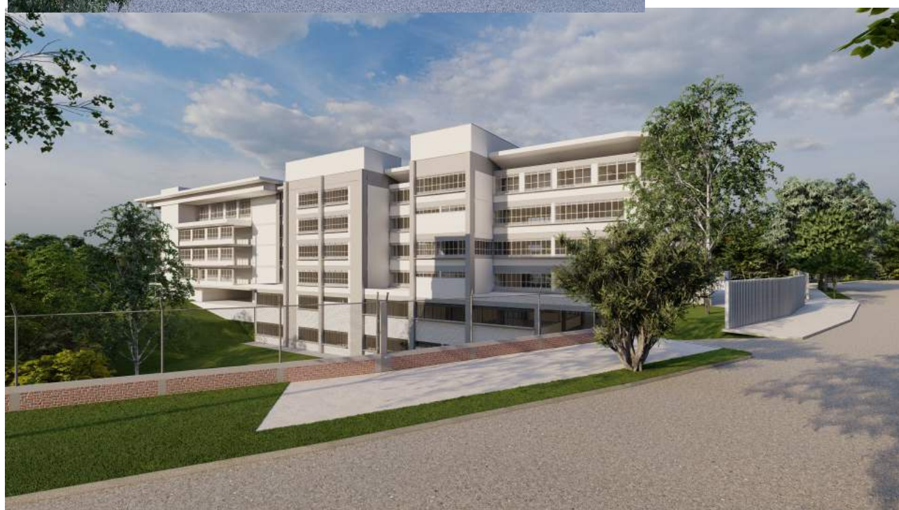
Vista General Bloques A y B