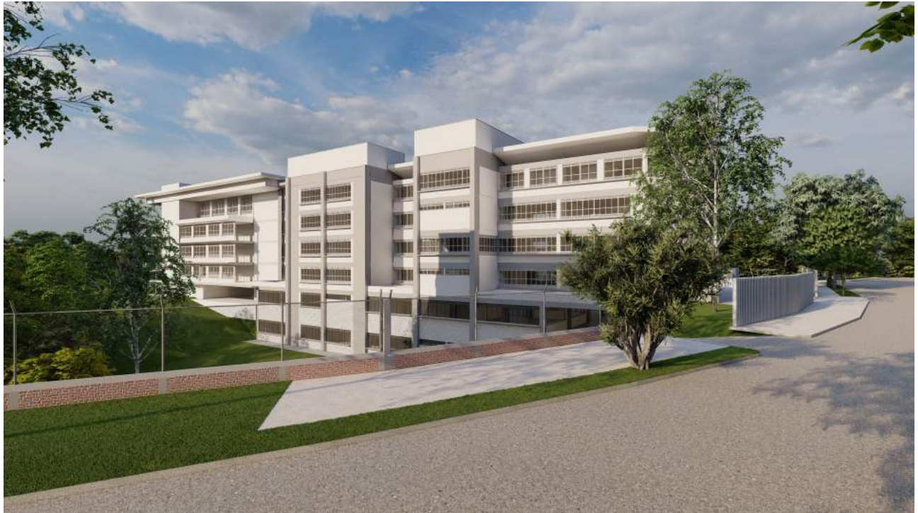
Vista Fachada Posterior.