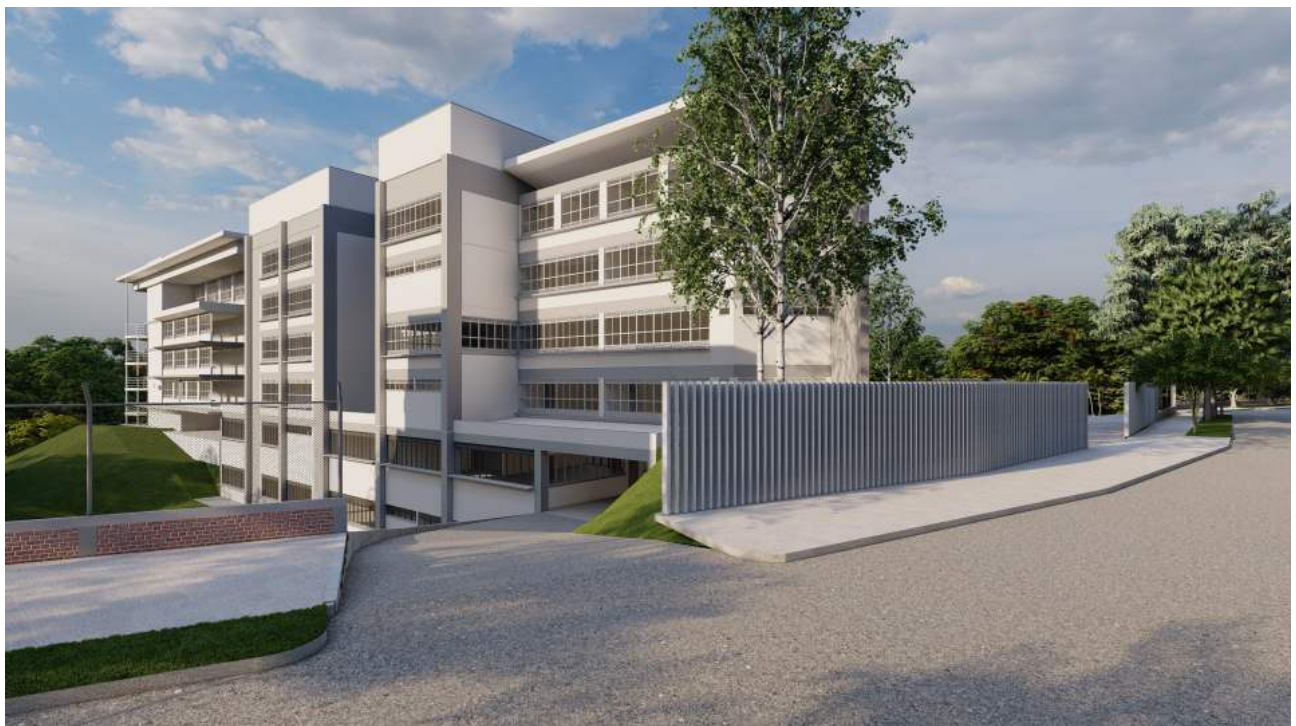
Vista Fachada Posterior.

Animación del proyecto: https://www.youtube.com/watch?v=dp2Rufmoflo