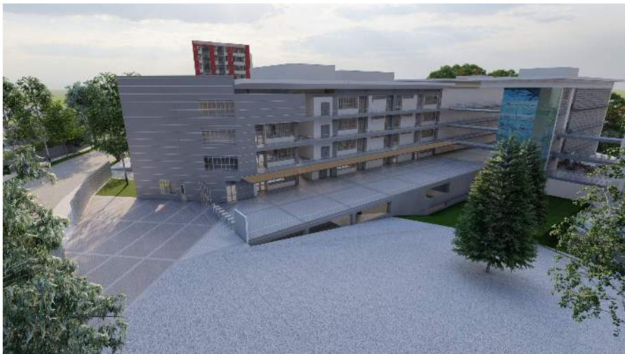
Vista General Bloques A y B