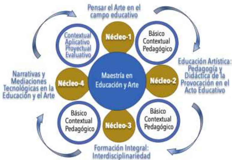
Figura 3. Organización nuclear

A continuación, se presenta la malla curricular con sus núcleos correspondientes y los conceptos secuenciales: