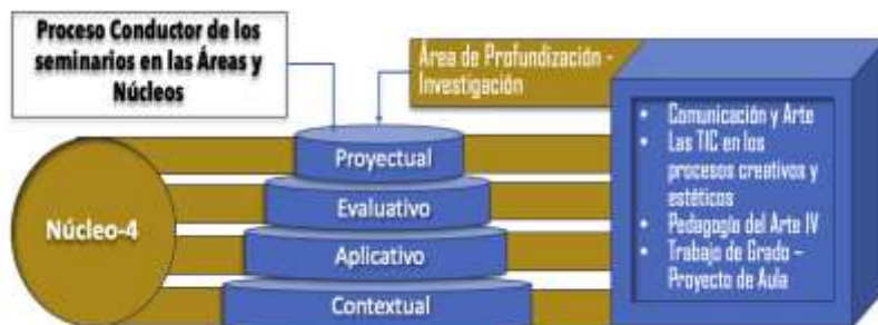
Figura 7. Núcleo 4: Narrativas y Mediaciones Tecnológicas en la Educación y el Arte-Investigación-Profundización

El Área de Investigación-Profundización del núcleo-4 , está dirigida a la investigación y aplicación de procesos pedagógicos de comunicación, creación y proyección a través de las posibilidades que brindan las TIC, así como a la consolidación y evaluación del proyecto final.