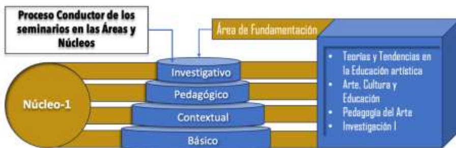
Figura 4. Núcleo 1 Pensar el Arte en el Campo Educativo

Bajo el Área de Fundamentación, el Núcleo-1 denominado " Pensar el Arte en el campo educativo ", contiene cuatro seminarios como se indica en la figura 4.