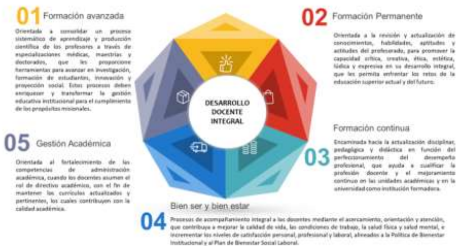
Figura 10. Líneas de actuación del Desarrollo Docente Integral

Cada una de estas líneas ha tenido un desarrollo para fortalecer el actuar del docente. El docente es un factor clave, ya sea como un participante activo a través de la construcción de espacios desde su práctica docente o realizando adaptaciones de las innovaciones con base en las condiciones particulares del contexto donde desarrolla su labor educativa. Esto implica avanzar hacia la formación de un nuevo docente que esté abierto al cambio, a la flexibilidad y a la reflexión sobre su práctica.