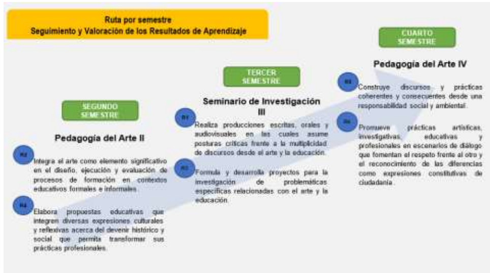
Figura 8. Ruta para el seguimiento y valoración de los resultados de aprendizaje

Seguimiento y valoración de los resultados de aprendizaje 2 y 4: