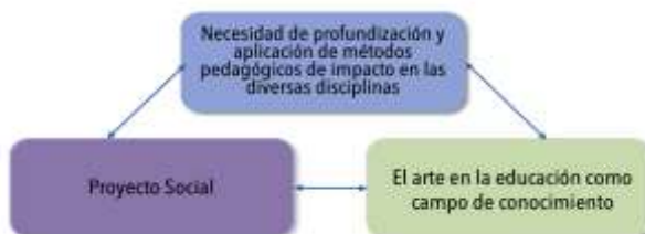
Figura 2. Rasgos distintivos

En primer lugar, su contribución a solucionar las necesidades del programa en pregrado de Licenciatura en Artes Visuales, brindado por la Universidad Tecnológica de Pereira, para profundizar en la formación integral y trabajo profesional de los egresados en los ámbitos educativo-pedagógico del arte.