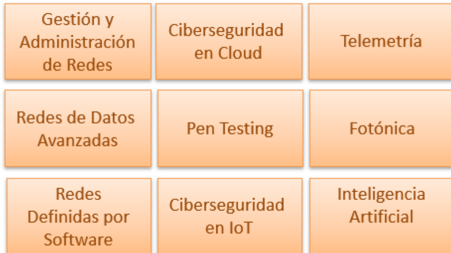
Figura 2: Electivas