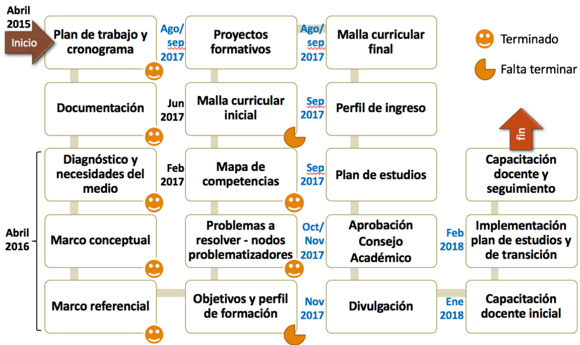
Figura 1. Plan de trabajo reforma curricular programa de ingeniería mecánica.

En abril de 2015, el Comité Curricular dio inicio al proceso de revisión curricular del programa de ingeniería mecánica. Desde ese entonces se ha venido desarrollando un plan de trabajo, que se resume en la siguiente gráfica. Dicho plan de trabajo se estima que esté finalizado durante el primer semestre de 2018, teniendo como resultado un nuevo plan de estudios del programa, que este a la vanguardia de las tendencias en educación en ingeniería nacionales e internacionales.